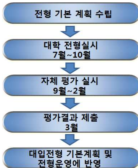
〈그림 2. 목원대학교 선행학습 영향평가 절차〉

위의 일정을 참조하여, 본 목원대학교에서 시행한 선행학습 영향평가 절차는 아래 〈그림2〉와 같이 진행됨.