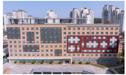
목원학사 V관 (남·여)